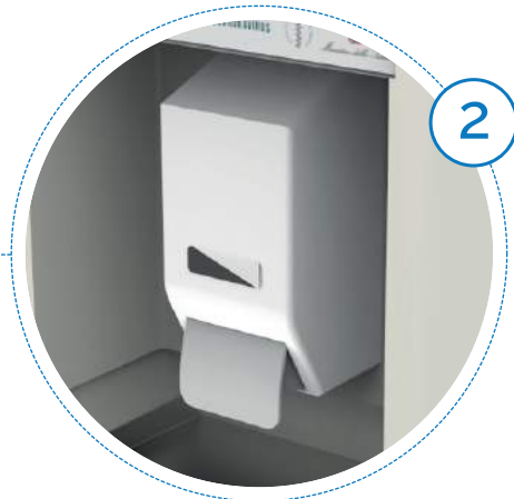
Dispenser soluzione igienizzante