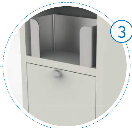
Dispenser mascherine e cassetto