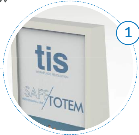
Pannello espositore per grafiche